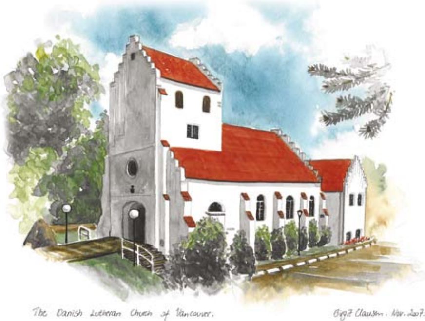
The Danish Lutheran Church of Vancouver.