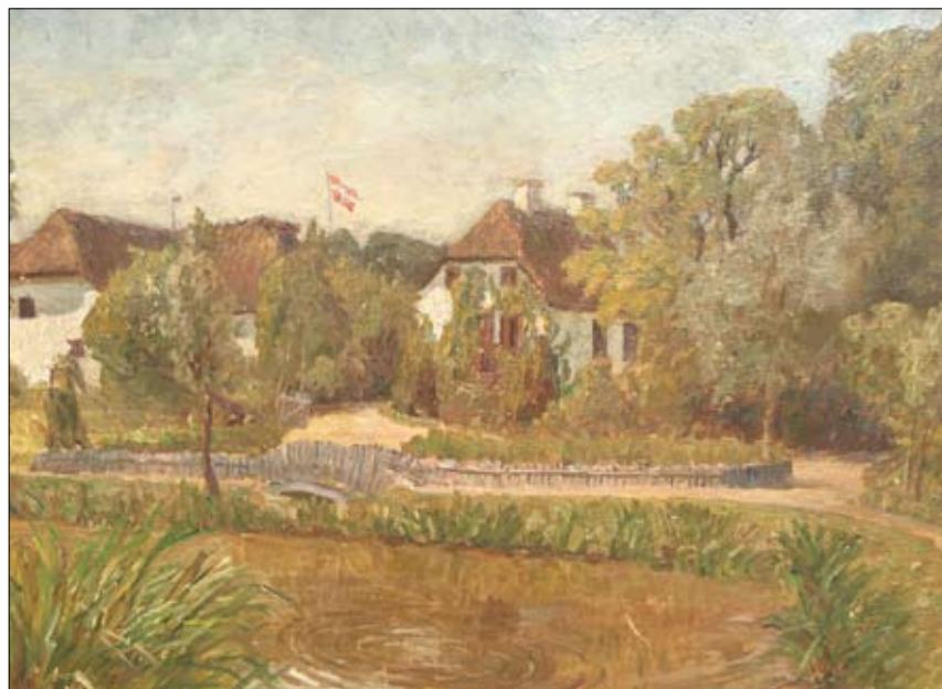
Sådan så Tommerup præstegård ud, da den lå i Tommerup. I dag er den i Den fynske Landsby - og er rød. Hør historien om det på udflugten tirsdag den 15. august!

Udflugten koster 250 kr., som betales på turen. Man kan tilmelde sig på kirkekontoret, tlf. 64 76 12 54 - hver onsdag og fredag mellem 8 og 13.