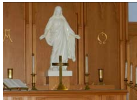
I kirken i Elk Horn finder man selvfølgelig en kopi af Thorvaldsens Kristusfigur ...

PS: Og så bød vor ferietur ellers også på dansk-amerikansk konfirmation i Wisconsin, besøg i flere dansker-småbyer i Nebraska, gensyn med gamle venner i den danske kirke i Vancouver, masser af fantastiske naturoplevelser - bl.a. seks bjørne - og meget, meget mere. Men det er en helt anden historie!