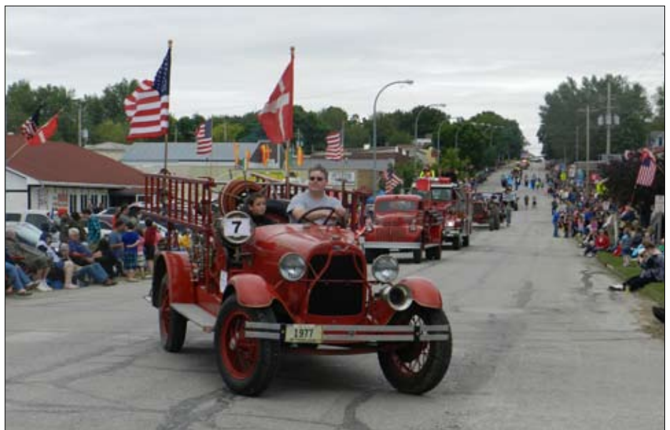
Fest og farver, flag og optog - og masser af mennesker til Tivolifest i Elk Horn

Også det danske immigrantmuseum, der ligger i udkanten af byen og rummer en udstilling om udvandrernes historie og netop nu viser en særudstilling om nordisk brændevin, er man glade for. Og da Kimballton naturligvis ikke vil stå tilbage for nabobyen har man her et fint lille anlæg med en kopi af den lille havfrue (The Little