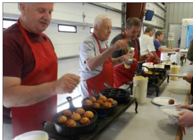
Der var fuld gang i æbleskiveproduktionen, for der var mange munde, der skulle mættes.

Vindmøllen i Elk Horn byder velkommen til danskerbyen, og - som disse billeder viser - er der liv og glade dage, når der holdes Tivolifest og spises æbleskiver og medisterpølse hvert år i maj.