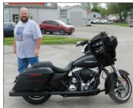
Borgmesteren med sin Harley-Davidson.