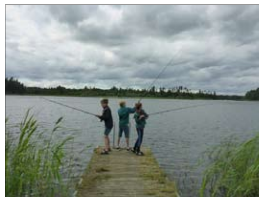
Der fiskes i en stor sø ved Blidingsholm ...

Tekst: Josefine Clausen.