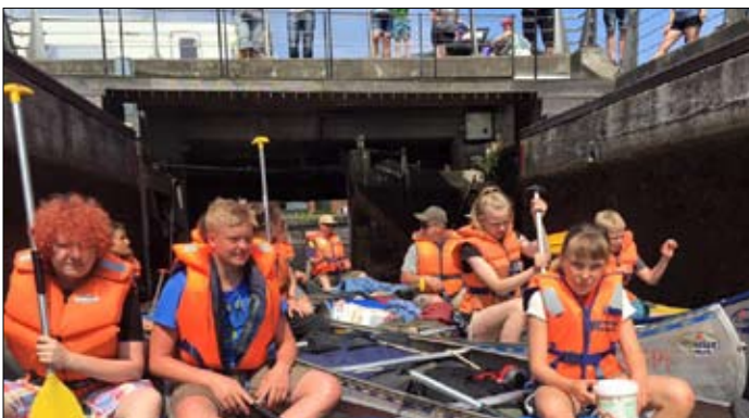
På vej gennem slusen ind til Silkeborg ...