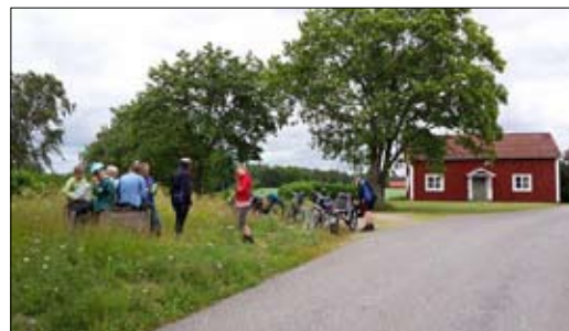
Og på cykeltur i den svenske natur ...