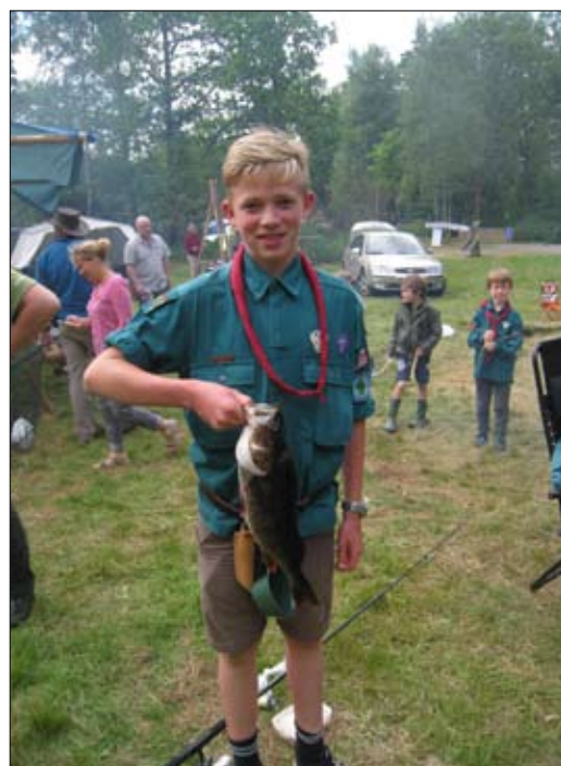
En stor fangst ved lystfiskeriet ...