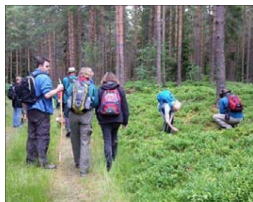
En tur i den store svenske skov ...