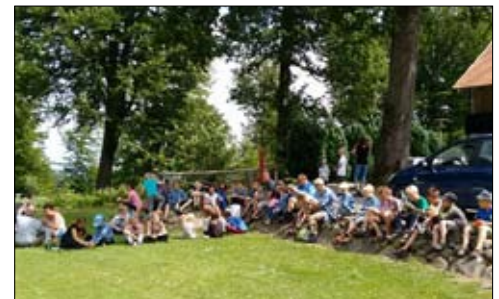
En velfortjent frokost på Himmelbjerget ...

Her kan man også altid finde aktuelle informationer om os. Man kan også altid besøge os på vores FDF-grund om tirsdagen fra kl. 17.30-20.30, hvor der er FDF-møder for store og små. Se mere om mødetider på www.fdf-tst.dk