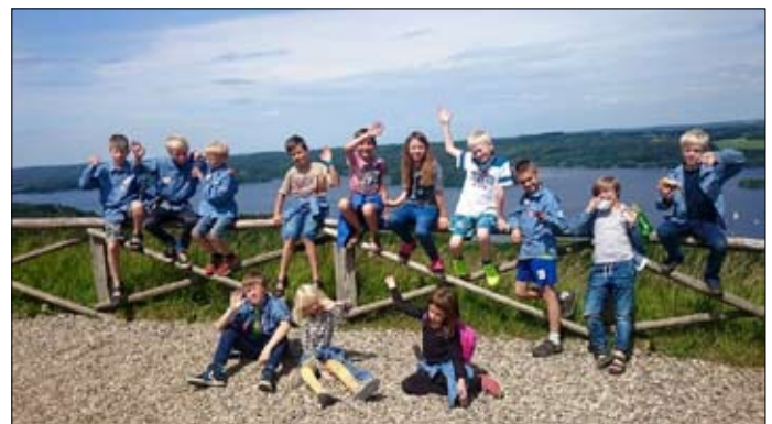
En herlig flok FDF-ere og en flot udsigt fra Himmelbjerget ...